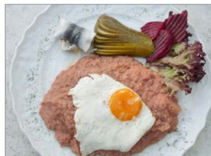
Im Norden gibt es oft Labskaus, Rollmops oder Krabben.

Jedes Bundesland hat eine eigene Regierung. Sie trifft Entscheidungen für das Land. Deshalb haben die Schüler zu unterschiedlichen Zeiten Ferien. Sie lernen im Unterricht nicht genau das Gleiche. Jedes Bundesland bestimmt, welche Regeln in der Corona-Krise gelten. Und natürlich gibt es verschiedene Bräuche , anderes Essen und viele Dialekte . Das hast du sicher schon bemerkt, wenn du in Deutschland unterwegs warst.