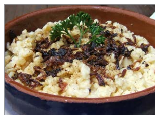
Im Süden isst man gerne Käsespätzle oder Schweinebraten mit Knödeln.