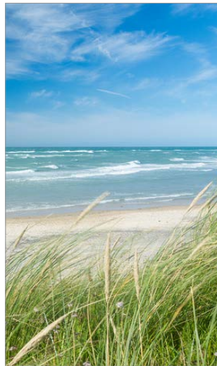
Im Norden ist das Meer.

Im Norden Deutschlands liegen die Nordsee und die Ostsee. Dort gibt es tolle Strände und Inseln. Deutschland hat unterschiedliche Landschaften: flache Gebiete mit Wiesen und Feldern, große Wälder und die Mittelgebirge . Wir haben große Seen und lange Flüsse, zum Beispiel den Rhein und die Elbe. Im Süden liegen die Alpen. In dem Gebirge ist auch der höchste Berg, die Zugspitze.