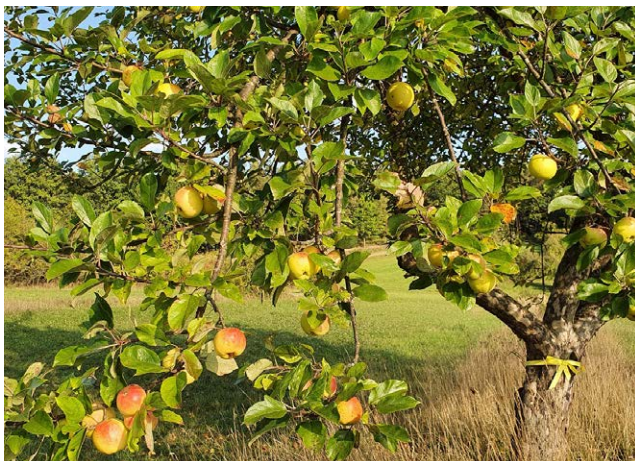
Diese Äpfel darf jeder ernten.

Deutschland war lange Zeit geteilt. Es gab Ostdeutschland und Westdeutschland. Die Grenze war streng bewacht. Man konnte nicht frei hin und her reisen. Am 3. Oktober 1990 wurden die beiden Teile wieder zu einem Land vereint. Deshalb feiern wir seit 30 Jahren am 3. Oktober den „Tag der Deutschen Einheit“.