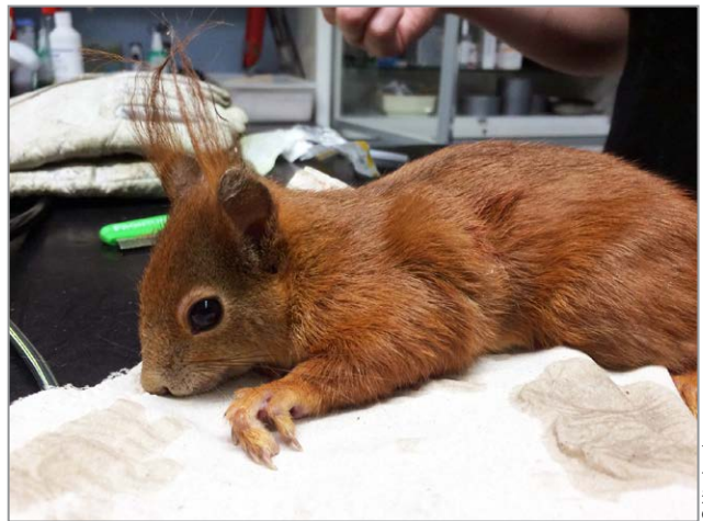
Das Eichhörnchen wird untersucht.

In Melsungen fand eine Frau ein junges Eichhörnchen im Garten. Es bewegte sich kaum, deshalb brachte sie es zur Tierärztin. Das Tierchen erholte sich so schnell, dass es am nächsten Tag aus dem Käfig entwich und in der Praxis herumsprang. Die Ärztin öffnete ein Fenster und das Eichhörnchen war wieder frei.