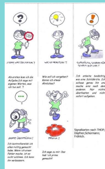
Döpfner, Schürmann, Frölich. 2019. Therapieprogramm für Kinder mit hyperkinetischem und oppositionellem Problemverhalten THOP . Verlagsgruppe Beltz